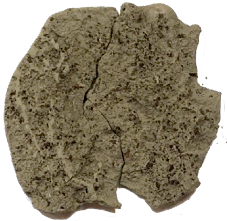
La pelle degli alberi

Si inizierà con una passeggiata lungo gli argini del fiume Senio, durante la quale si potranno raccogliere diversi elementi della natura che poi verranno rielaborati attraverso diverse tecniche scultoree e pittoriche, creando così un' opera collettiva che andrà crescendo nel corso dei 4 incontri.