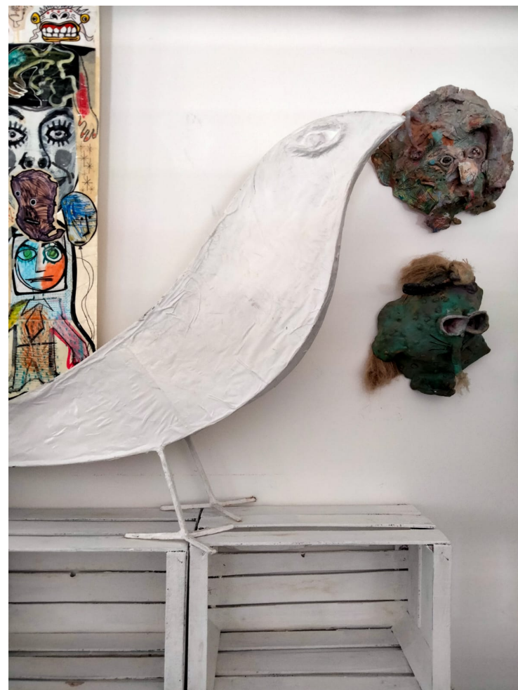
Scuola Arti e Mestieri, Cotignola (RA)